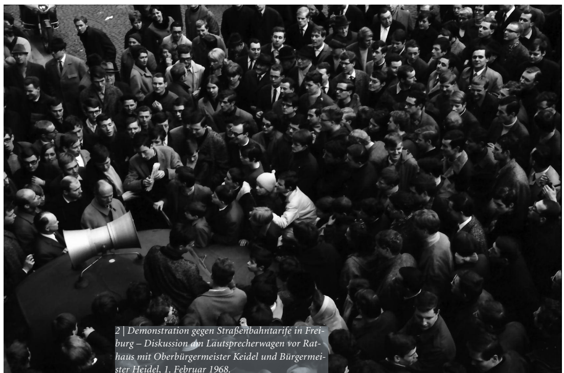
2 | Demonstration gegen Straßenbahntarife in Freiburg – Diskussion an Lautsprecherwagen vor Rathaus mit Oberbürgermeister Keidel und Bürgermeister Heidel, 1. Februar 1968.

Diese Ereignisse wurden auch in Freiburg aufmerksam beobachtet. Die Badische Zeitung berichtete. Die Freiburger Verkehrsbetriebe wurden initiativ und wandten sich an die Stadtverwaltung: Es ist wohl nicht anzunehmen, dass in Freiburg die Schüler und Lehrlinge den Betrieb stören werden. Es könnte aber sein, dass von Seiten eines Teils der Studenten nach dem Beispiel Bremen ähnliches versucht wird. Auch eine Gegenstrategie wurde vorgeschlagen: Man könnte hier die bevorstehende Faschingszeit ausnutzen: Wenn sich jüngere Menschen auf