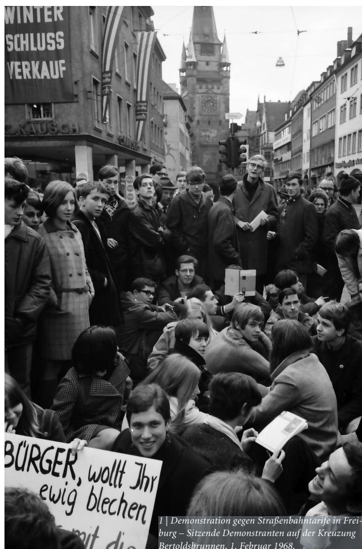
1 | Demonstration gegen Straßenbahntarife in Freiburg – Sitzende Demonstranten auf der Kreuzung Bertoldsbrunnen, 1. Februar 1968.

fahrung und eine damit verbundene Distanzierung von den Institutionen der parlamentarischen Demokratie: Im Verlauf der Ereignisse kam es erstmalig in Baden-Württemberg zu einem Einsatz von Wasserwerfern und zu einem massiven Schlagstockeinsatz, um die Bertoldstrasse wieder für den Verkehr freizumachen.