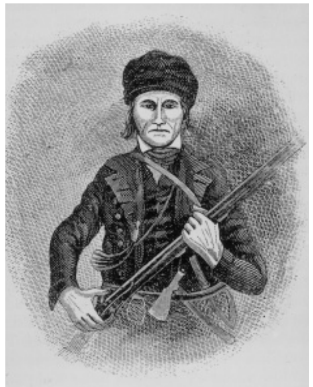
Ein Pfälzer Pionier im 18. Jahrhundert. Vorlage: Rudolf Cronau, S. 108

Bevölkerungsverlusten während des Dreißigjährigen Krieges Glaubensflüchtlinge aus Frankreich, dem Piemont, aus Österreich und Wallonien aufgenommen, Schweizer Mennoniten und auch Wirtschaftsflüchtlinge aus dem gesamten Alpenraum besiedelten die verödeten Dörfer in den von den Kriegswirren besonders betroffenen Gebieten. Südwestdeutschland hatte zu Beginn des 18. Jahrhunderts noch nicht die Bevölkerungszahlen vor dem Dreißigjährigen Krieg erreicht, und dennoch begann zu dieser Zeit bereits die Auswanderung. Wie ist dieser Wechsel von Ein- zu Auswanderung zu erklären? Wo lagen die Gründe für die bereits kurz nach 1700 einsetzende Massenauswanderung?