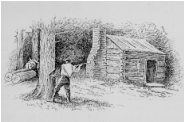
Eine Siedler beim Bau einer ersten Unterkunft.

des Handels eins geworden ist, so geschieht es, daß erwachsene Personen für diese Summe nach Beschaffenheit und Stärke und Alters 3, 4, 5–6 Jahre zu dienen sich schriftlich verbinden. Die ganz jungen Leute aber müssen servieren, bis sie 21 Jahre alt sind. 10 Anzeigen in deutschsprachigen amerikanischen Zeitungen bestätigen Mittelbergers Schilderung: Philadelphia , den 9. November 1764. Heute ist das Schiff „Boston“ hier angelangt mit etlichen 100 Deutschen, unter welchen sind allerlei Handwerker und junge Leute, sowohl Manns- wie Weibspersonen, auch Knaben und Mädchen. Diejenigen, welche geneigt sind, sich mit dergleichen zu versehen, werden ersucht, sich zu melden bei D. Rundle in der Frontstraße. 11 Während der Dienstzeit konnten die Redemptiöner weiter verkauft werden, wie eine weitere Anzeige bestätigt: Philadelphia , 4. August 1766. Es ist zu verkaufen einer deutschen Magd Dienstzeit; sie ist ein starkes, frisch und gesundes Mensch und wird keines Fehlers wegen verkauft, sondern nur, weil sie sich in den Dienst nicht schickt, in welchem sie jetzt steht; sie versteht alle Bauernarbeit, wäre auch gut für ein Wirtshaus; sie hat noch 5 Jahre zu stehen. 11 Der Deutschenhandel , wie man das Redemptiöner-System auch nannte, führte häufig zu brutaler Ausbeutung. Um die Neuankömmlinge davor zu schützen entstanden Deutsche Gesellschaften . Die erste wurde von dem 1738 aus Treschklingen bei Bad Rappenau ausgewanderten Kaufmann Heinrich Keppel 1764 in Philadelphia gegründet.