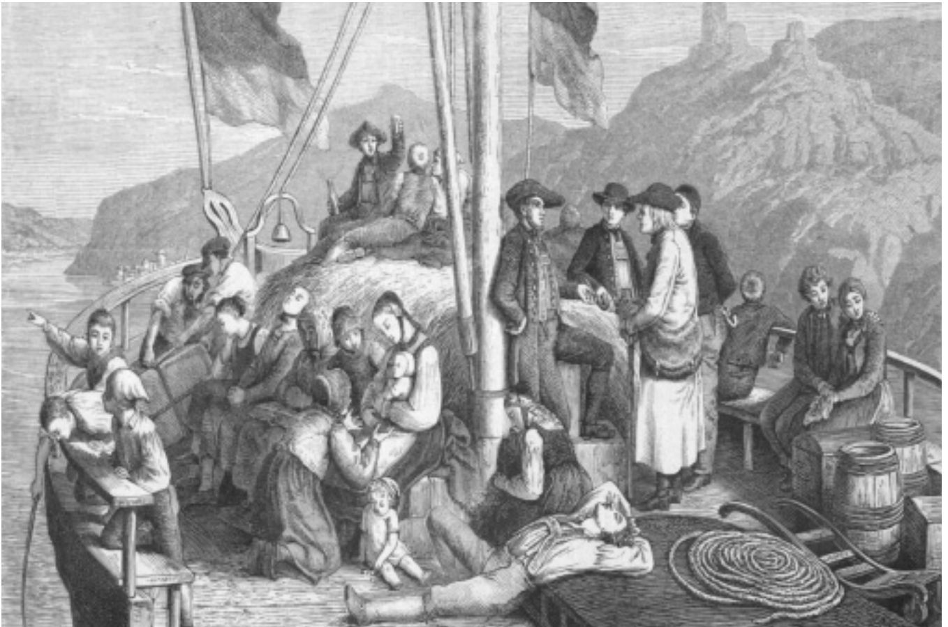
Der erste Reiseabschnitt: Auswanderer auf dem Rhein, Darstellung in der Gartenlaube von 1864, S. 85.