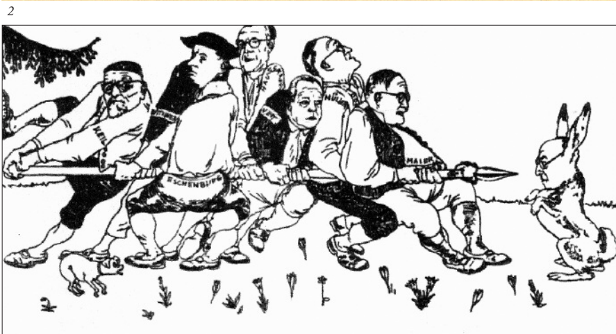
2 | Stereotype „Badener“ und „Schwaben“: Postwurfsendung.

Polarisierungseffekte zeigte auch die auf beiden Seiten betriebene und zugespitzte Stilisierung der inhaltlichen Streitpunkte, z.B. als Frage der Bewahrung von Identität oder der Sicherung der Zukunft. Bemerkenswerterweise wurden dabei die von der Gegenseite verwendeten Stilisierungen bewusst aufgegriffen, in veränderter Form in die eigene Argumentation integriert und damit als Waffe des politischen Gegners entschärft (Material 7 und 8). Als Beispiel für eine besonders dreiste Zuspitzung der Kampagne gegen die Südweststaatler sei der ebenso einprägsame wie absurde Kampfbegriff Stuttgarter Wirtschaftsimperialisimus genannt, der sich im Badnerland , der Kampfzeit-schrift der Südweststaatsgegner, fand.